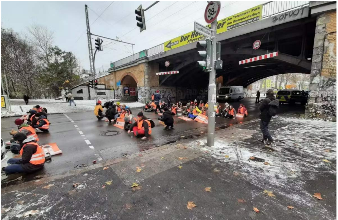
Foto: videofragment 'klimaatklevers' in Berlijn

Decennialang zijn er al verhalen over naderende klimaatrampen, maar ze bleken steeds ongegrond. Belangrijke informatie over de echte oorzaken van klimaatverandering wordt genegeerd door officiële instanties en de mainstream media. En dat is merkwaardig, want er is geen enkele reden om je zorgen te maken over CO2 in relatie tot de door het IPCC voorspelde opwarming. In 2019 werd namelijk ontdekt dat de belangrijkste oorzaak van opwarming vooral komt door de variatie in de afstand tussen de Zon en de Aarde en niet door CO2. Het huidige klimaatbeleid is daarom gebaseerd op slechte wetenschap en schaadt o.a. de economie van westerse landen op dramatische wijze.